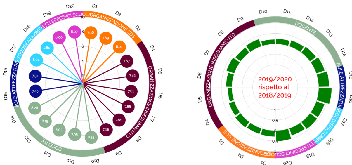
Figura 1 – Valori medi, riepilogo per CdS e per domanda, con confronto CdS anno precedente

Il Gruppo di Gestione AQ rileva che in generale la valutazione della didattica del corso può essere considerata assolutamente soddisfacente, con la maggior parte dei punteggi medi pari o superiori a 8 e con il punteggio peggiore pari a 7,5 (domanda n. 16). Da notare, inoltre, che tutti gli aspetti soggetti a valutazione hanno ottenuto un punteggio superiore rispetto all'anno precedente (figura 1).